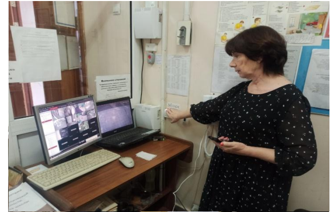
Доведение сигнала оповещения