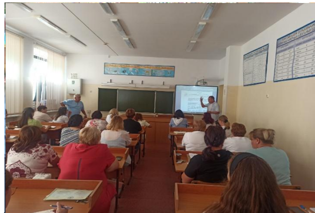
Разбор вводной задачи