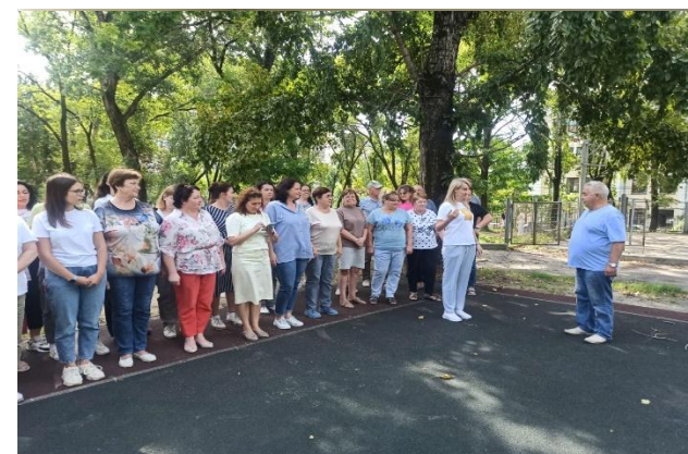
Место сбора эвакуированного персонала