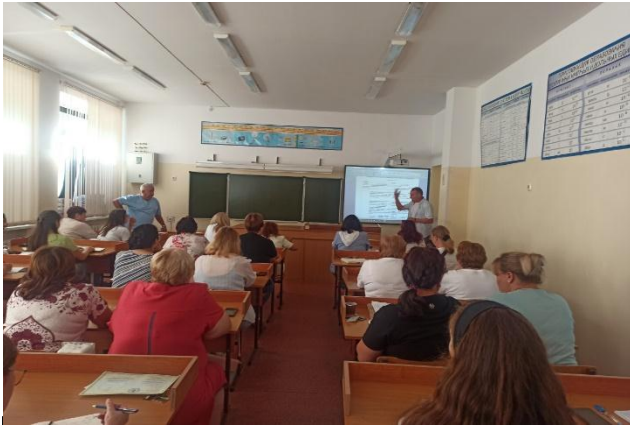
Подготовка к проведению учений