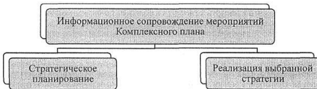
Рис.2. Планирование информационного сопровождения мероприятий Комплексного плана

Необходимость информационного сопровождения обусловлена растущей активностью радикальных группировок в информационном пространстве в целом. При этом антитеррористическая и антиэкстремистская деятельность остается неизвестной и непрозрачной для гражданского общества. Планирование информационного сопровождения предполагает два уровня (см. рис. 2).